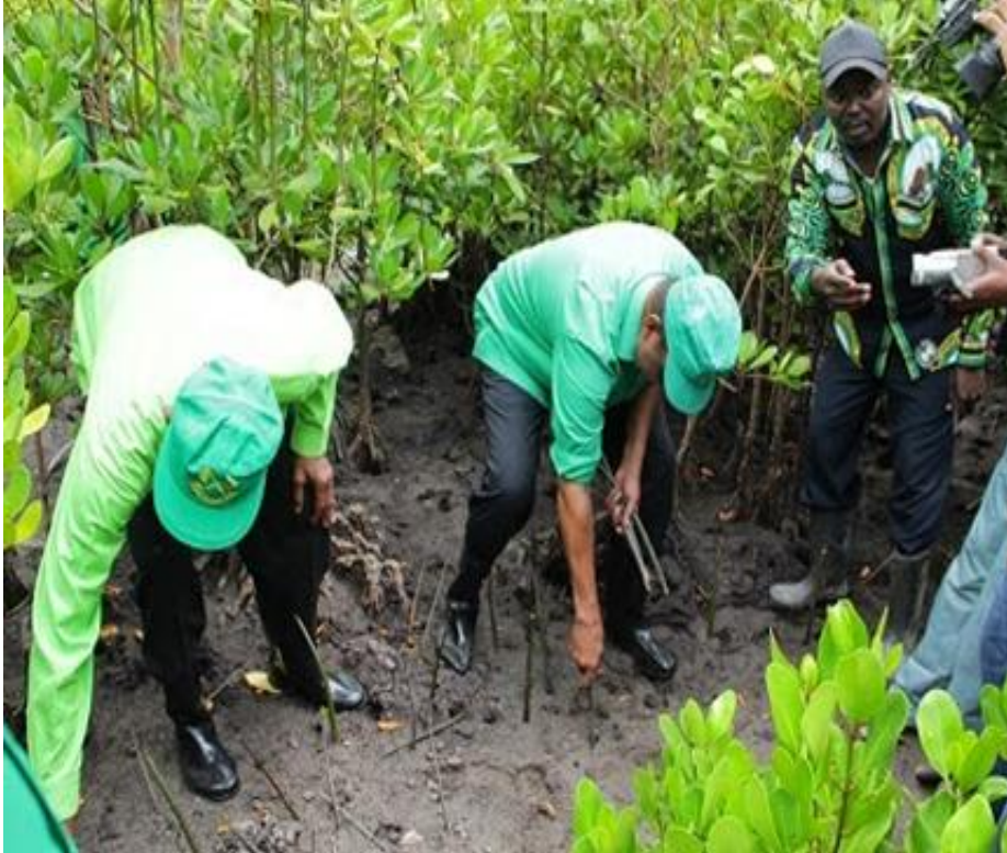
Katibu Mkuu wa CCM Ndg. Abrahaman Kinana akijumuika na wananchi wa kikundi cha kuhifadhi Mazingira Fuoni Kibondeni katika upandaji wa miti ya mikoko ili kutunza mazingira ya eneo hilo, akiwa katika ziara yake kukagua miradi ya maendeleo na utekelezaji wa Ilani ya Uchaguzi ya CCM