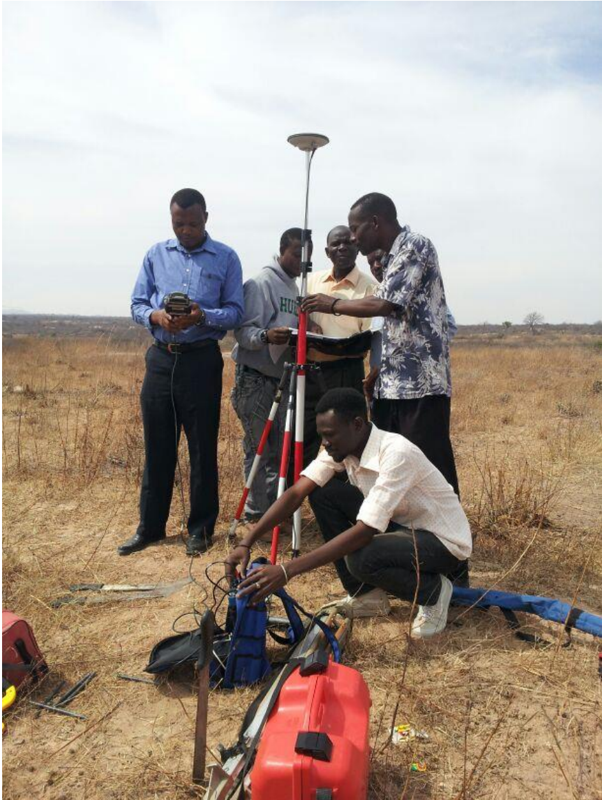
Wafanyakazi wa Mamlaka ya Ustawishaji Makao Makuu (CDA) wakipima viwanja kwa kutumia vifaa vya kisasa