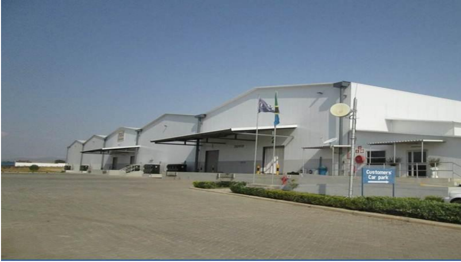
Moja ya ghala la Bohari Kuu ya Dawa kwa ajili ya kuhifadhi Dawa katika Kanda

50. Kwa kuzingatia dhamira ya kuwa na wananchi wenye afya bora watakaoweza kushiriki katika shughuli mbalimbali za kiuchumi na kutoa huduma katika miaka mitano ijayo, Chama Cha Mapinduzi kitaielekeza Serikali kuendelea kuhakikisha kwamba wananchi wanapata huduma bora za afya kwa kufanya yafuatayo:-